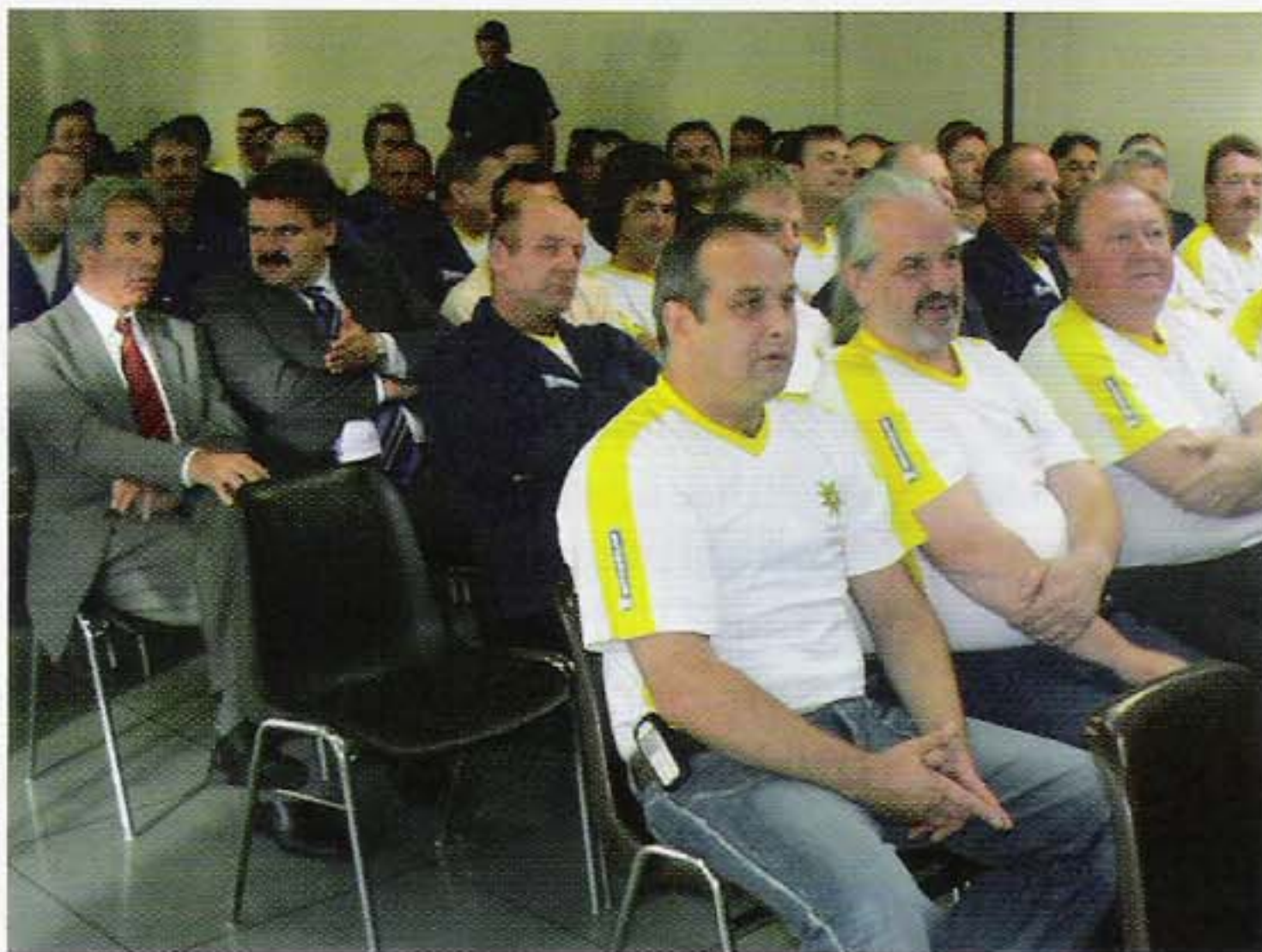
Der Festakt zum Qualitätspreis fand in der O-Kantine statt.