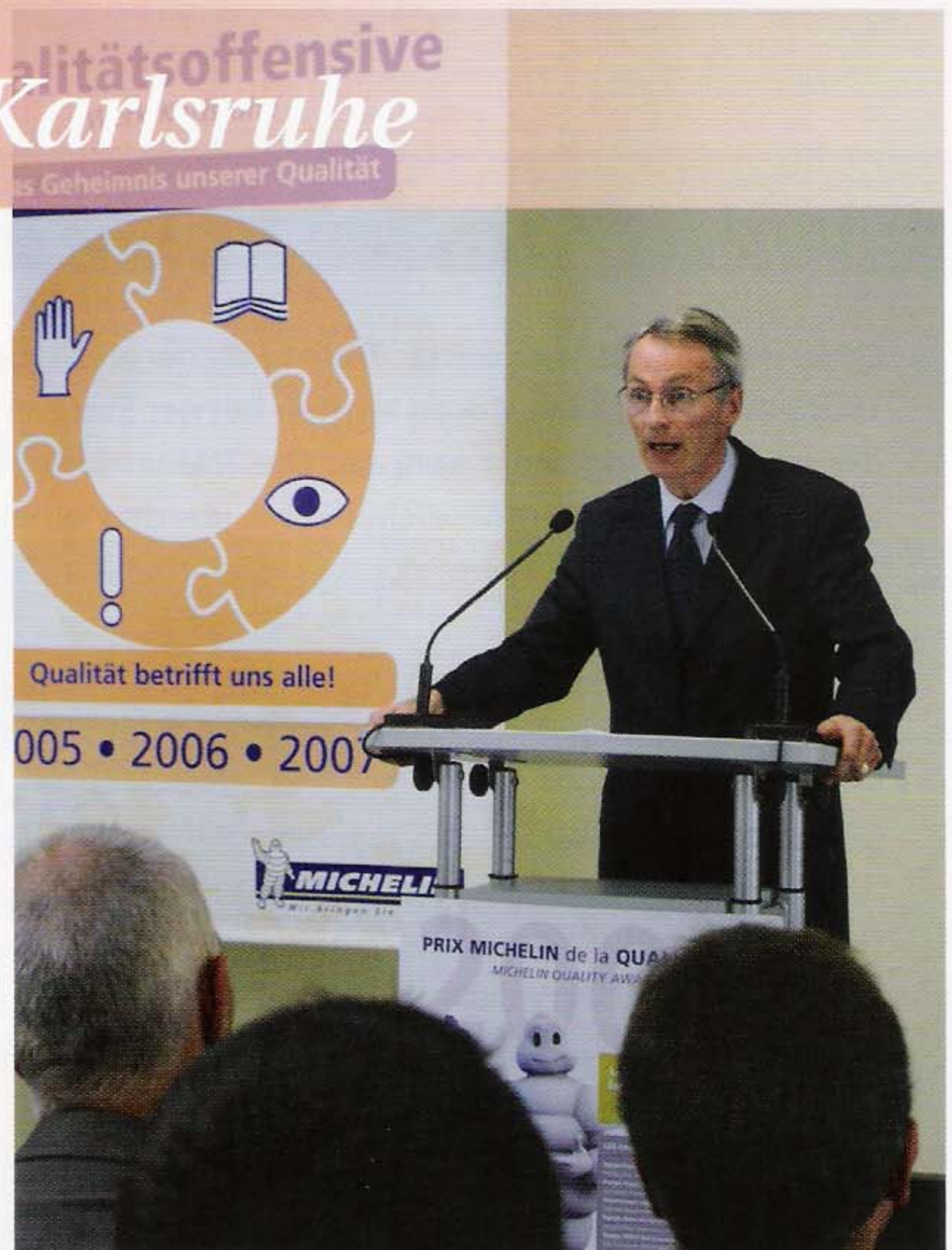
Anlässlich der Preisverleihung in Karlsruhe kam Jean-Dominique Senard erstmals als Mitgeschäftsführer der Gruppe nach Deutschland und überraschte die Gäste mit sehr guten Deutschkenntnissen.

Jean-Dominique Senard, seit Mitte Mai Mitgeschäftsführer der Michelin Gruppe, kam extra zur Preisverleihung nach Karlsruhe und gratulierte den Preisträgern zu ihrer Leistung. „Qualität ist nie ein Endzustand, sondern ein kontinuierlicher Prozess, eine andauernde Reise zum Ziel ‚Verbesserung‘, zu dem man sich immer wieder neu aufmachen muss. Dies ist in Karlsruhe während der letzten zwei Jahre vorbildlich gelungen und stärkt Michelin auch gegenüber den Mitbewerbern“, so seine anerkennenden Worte.