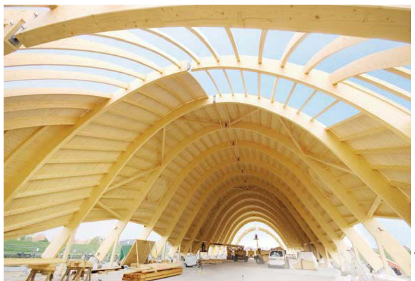
GEBR. SCHÜTT KG