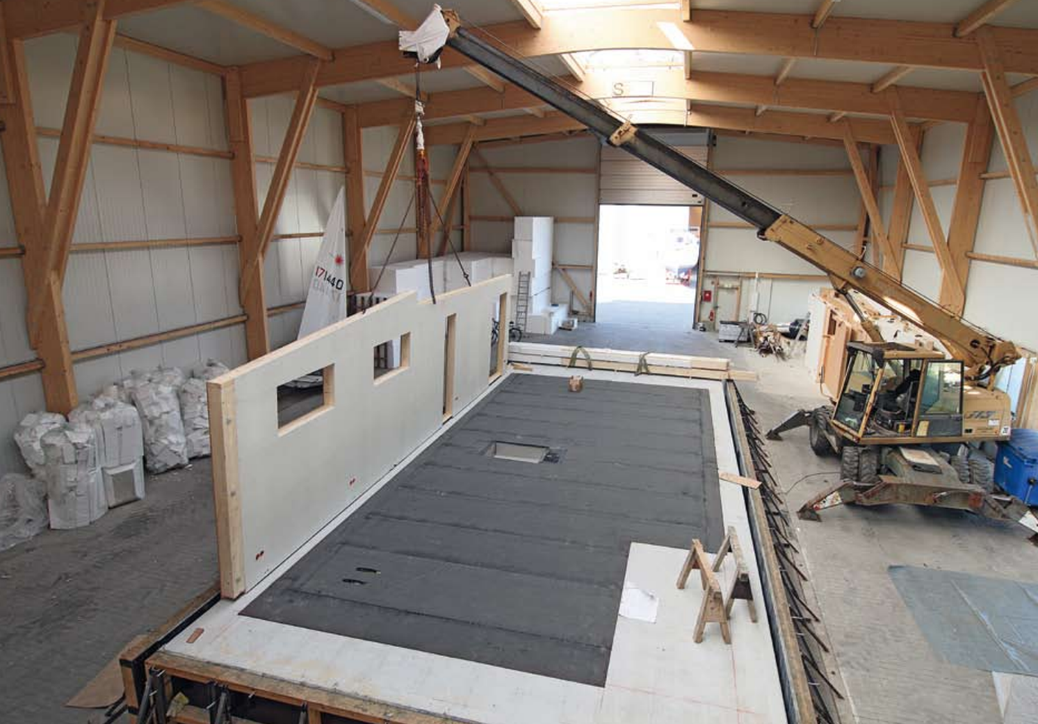
▲ Ein Mobilkran hebt in der Yachthafen-Halle die angelieferten Elemente zur Montage in ihre Position

H äuser haben ein Fundament und stehen auf dem Land. Boote haben einen Rumpf und schwimmen auf dem Wasser. Aber wozu braucht man Häuser auf schwimmenden Fundamenten?