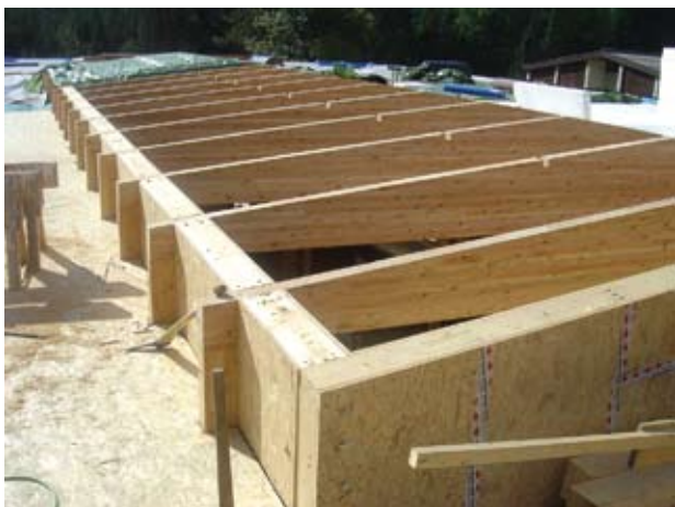
Bild 10 Übersicht über die Satteldachträger der Atriumüberdachung. Die Einbindung der Träger (10/18-66 BS14/1) in die Attikakonstruktion stellt zugleich die Gabel-lagerung dar.