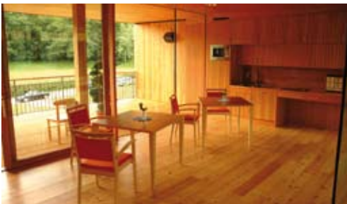
Bild 20 Bezug zum Außenraum stellen die offenen Tagesräume als Übergänge zu den geschützten Terrassen dar, die reizvolle Bildausschnitte der Landschaft ins Haus holen. Jeder Raum des Gebäudes ist barrierefrei ausgeführt.

Kalkuliert wurde beim Pflegeheim Steinfeld sehr genau. Die Baukosten pro Bett liegen bei 90.000 Euro zwar hoch, jedoch niedriger als bei den Vorarlberger Beispielen, die in einer Zeit gebaut wurden, als die Frage der Kosten einer überalterten Gesellschaft noch nicht omnipräsent war. SJ