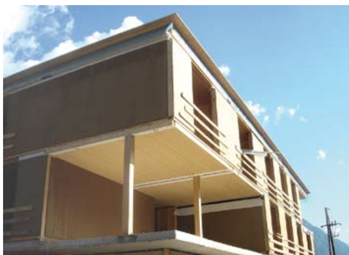
Bild 9 Über dem 2. OG ist ein umlaufender Attikaträger aus BS-Holz angeordnet. Von ihm wurde die Loggia-Decke über dem 2. OG (siehe Bild 1) abgehängt.

resultiert aus den Einzelwänden der aneinandergereihten „Wohnboxen“. Für diese Trennwände ergeben sich Gesamtdicken von 30,5 cm (2 x: 10 cm KVH-Holzständer mit Mineralwolldämmung, raumseitig 10 mm + 12,5 mm Gipsfaserplatten, zur Trennfuge hin 15 mm OSB-Platte. Die Trennfuge selbst ist mit 30 mm Mineralwolle ausgefüllt).