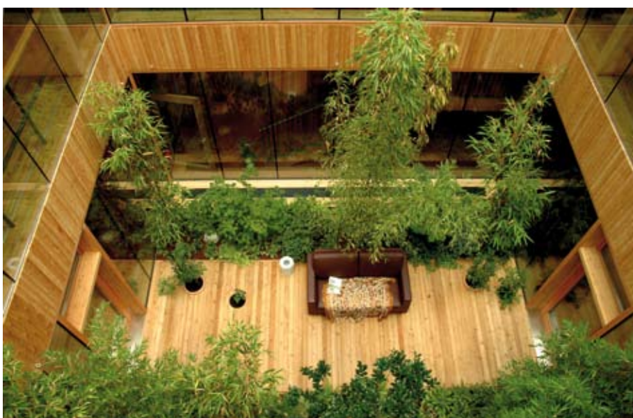
Bild 4 In der „grüne Lunge“ des Hauses, dem Wintergarten oder Atrium, kann man es sich gemütlich machen. Architekt Wisounig schuf eine Wohnatmosphäre, wie sie ihm selber angenehm wäre.

Als Wandscheiben vorgefertigte Holztafelbau-Elemente ( Bild 5 ) und Brettstapeldecken ( Bild 14 ) bilden vom Prinzip her „selbsttragende Wohnboxen“. Sie wurden untereinander über doppelschalige Wohnungstrennwände schall- und brandschutztechnisch entkoppelt. Die Doppelschaligkeit