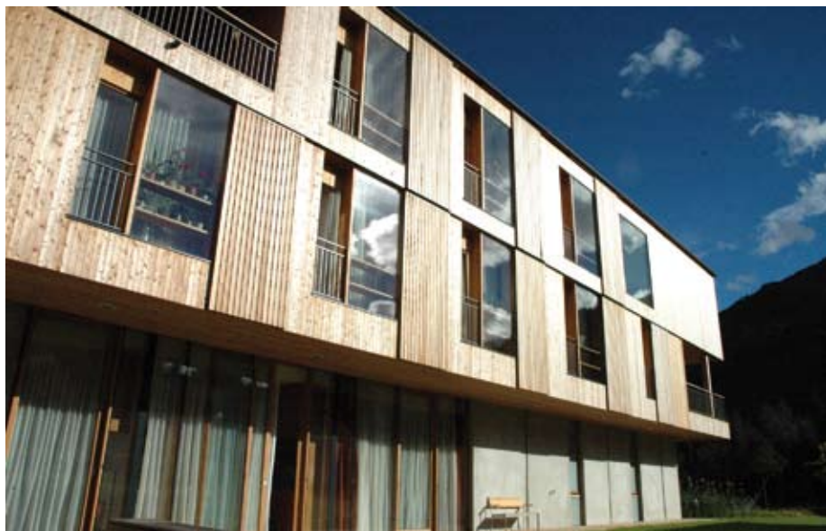
Bild 15 Der Architekt verstand es, drei der Fassaden mit einer spielerischen, dabei präzisen Setzung großzügig verglaster Öffnungen und mehrerer raumtiefer Einschnitte für Loggien durchlässig und leicht wirken zu lassen.