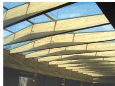
Bild 12 Die Verglasung der Atriumüberdachung spannt von Träger zu Träger. Links im Bild ist die Verzahnung der Satteldachträger mit der Attika, die Gabel-lagerung, gut zu sehen.