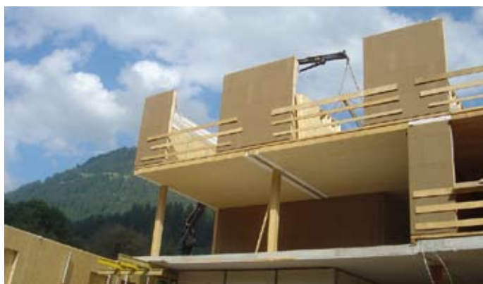
Bild 7 Montagebeginn 2. OG. Hier sieht man wie unterschiedlich die Grundrisse sind: Über der Loggia liegen zwei Wohneinheiten.