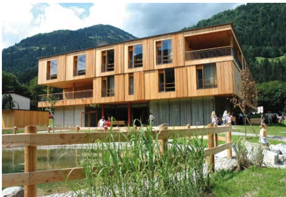
Bild 1 Der dreigeschossige, ost-west-orientierte Baukörper des Altenwohnheimes und der öffentliche Park bilden eine gestalterische Einheit. Die Gebäudeöffnungen, Terrassen, Wege und Bepflanzungen nehmen aufeinander Bezug. Auf der Nordseite befindet sich der Servicebereich des Gebäudes, während die intimeren Wohnzonen und die öffentlichen Nutzungen auf der Parkseite liegen.

Wer für alte Menschen bauen will, muss etwas über das Altern wissen. Das Altenwohn- und Pflegeheim Steinfeld (A) zeigt, dass ein Seniorenheim keine triste Verwahungsstätte sein muss.