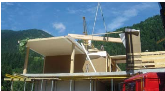
Bild 6 Versetzen eines Unterzuges im Treppenbereich per Kran im Hintergrund. Im Bereich der Loggia des 1. OGs wurden zwei Stahl-Unterzüge angeordnet, um dazwischen einen Installationsschacht durchführen zu können.