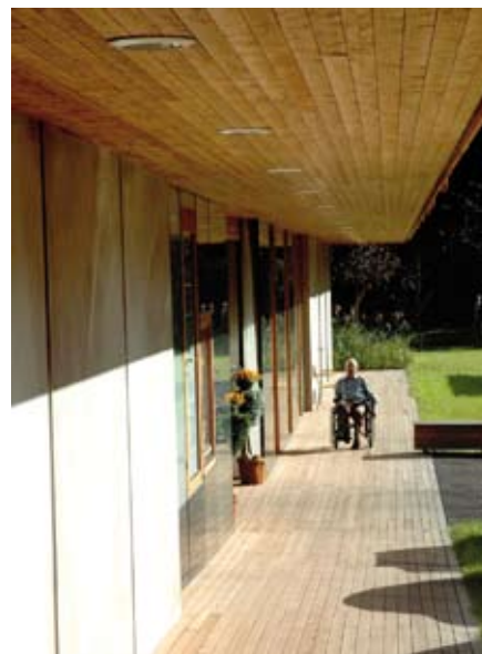
Bild 16 Die beiden oberen Geschosse springen zu allen Seiten über dem EG hervor, so dass ein überdachter Bereich rund um das Haus entsteht. Da sind die Bewohner oft und gern unterwegs.

Decken und Stützen sind über die Abbrandgeschwindigkeit und dem verbleibenden Restquerschnitt dimensioniert. Die massiven Bauteile sind durch Beplankungen mit Gipsbauplatten geschützt. Die Stahlprofile erhielten einen Brandschutzanstrich (Bild 13). Die Verglasungen zwischen Atrium und den um-