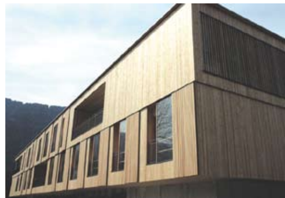
Bild 19 Die zur Straße gewandte Nordfassade, gewährt sparsame Einblicke, weil sich hinter ihren Lamellen Pflege- und Verwaltungseinrichtungen verbergen.

Die Wohnungsdecken erfüllen die Schallschutzanforderungen des Wohnbaus. Dies sind: Bewerteter Normtrittschallpegel L'_{n,T,w} < 48 \text{ dB} und Luftschall D_{n,T,w} > 55 \text{ dB} . Die Decken sind insgesamt zwischen 28 und 36 cm dick, je nach Dicke der Brettstapel-Elemente (zw. 10 und 18 cm). Der darauf folgende Deckenaufbau ist jeweils identisch mit 7 cm Schüttung, 2,5 cm Trittschalldämmplatte, 7 cm Estrich und 1,5 cm Parket.