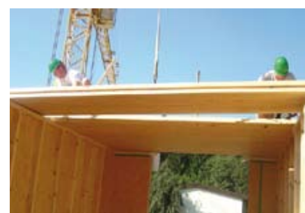
Bild 14 Verlegen der Deckenelemente mit fremder Feder. Nach dem Zusammenfügen werden die Halfertigelemente der Zimmertrennwände auf ihre Ausrichtung überprüft, und dann erst wird die Decke mit den Wandkronen verschraubt.