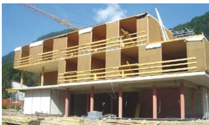
Bild 8 Der auf dem „Betontisch“ des EGS aufgesetzte Holzbau kragt allseitig 1,50 m aus. Das zweite Geschoss der hier gezeigten Südansicht ist fast fertig montiert.