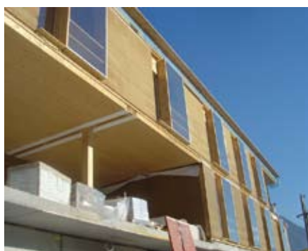
Bild 18 Die Fenster wurden bereits eingebaut bevor der Außenwand-aufbau (Dämmung, Lattung und Lärchenholz-Schalung) erfolgte. Fenster und Fassade sollten bündig sein – nur die hölzernen Schiebeläden (siehe Bild 19) setzen sich davon ab.