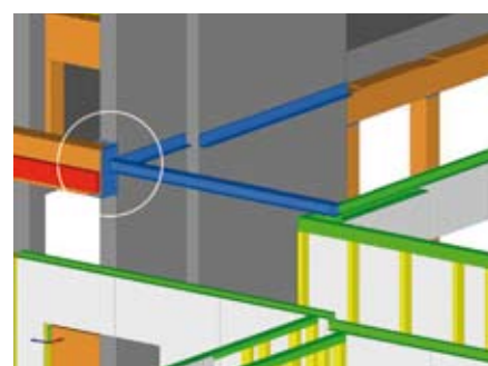
Bild 13 Brandschutzbeschichtete Stahlträger. Großer Aufwand, um „Flachdecken“ zu erreichen, von denen im Gangbereich die Installationen abgehängt wurden.

Ein besonderes Augenmerk wurde auf die reduzierte Ausführung der Satteldachträger der 20 m langen Atriumüberdachung gelegt: Die nur 10 cm breiten BS-Holz-Träger haben im First eine Höhe von 82 cm, die sich zu den Trägerenden hin auf 18 cm verjüngt. 15 Stück überspannen 7,50 m im Abstand von 1,25 m (Bilder 3, 10 und 12). Die Einbindung in die Attikakonstruktion stellt zugleich die Gabel-lagerung dar. Die Kippstabilisierung erfolgt in den 1/3 Punkten über durchlaufende Zugstäbe ( b/h = 5 \text{ cm}/5 \text{ cm} ), die in dafür vorgesehene Ausfräsungen der Trägeroberseite eingelegt sind (Bild 10).