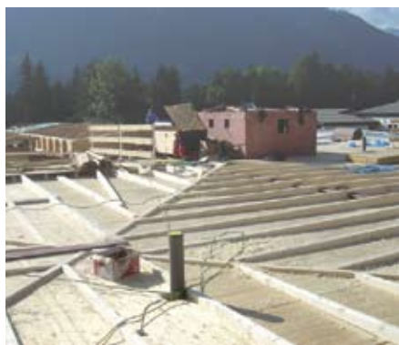
Bild 17 Die Gefällekonstruktion für die Dachentwässerung erfolgt mittels Dachlatten, auf die später eine OSB-Beplankung aufgebracht wird sowie die Dämmung und der restliche Dachaufbau.