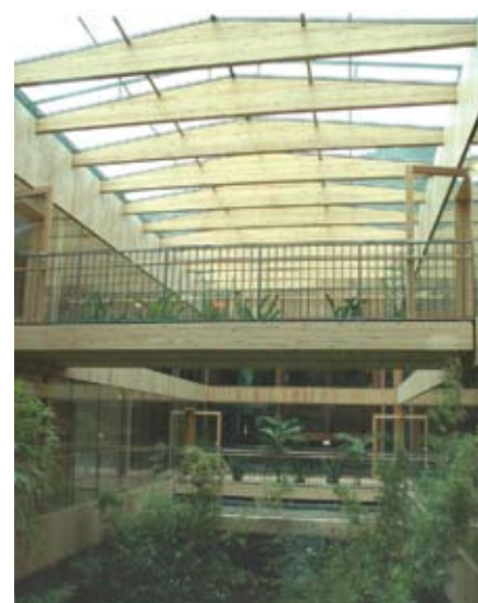
Bild 3 Den Gebäudekern bildet ein dreigeschossiges Atrium. Bis auf die beiden Verbindungsbrücken, die die Ebenen im 1. und 2. OG von Ost nach West verbinden, und die raumhohe Bepflanzung bleibt das Atrium frei von Einbauten. Es bringt alle Ebenen in Sichtbeziehung zueinander.

Die Herausforderung aus statisch-konstruktiver Sicht bestand in den hohen Anforderungen an den Brandschutz (R60 und R90) und die Bauphysik. Die schalltechnische Trennung jedes Zimmers, die wie einzelne separate Wohnungen zu betrachten waren, forderte eine konsequente Umsetzung in der tragenden Struktur: Einzelne Wohnboxen, die dennoch als Gesamteinheit wirken.